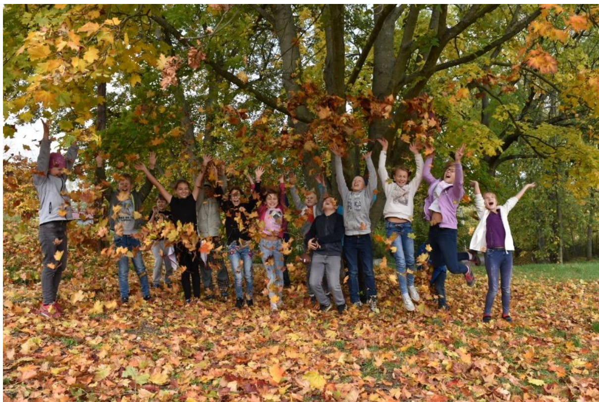
Výuka v přírodě