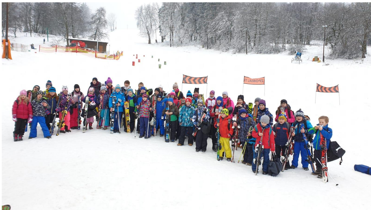
Zimní sportovní den na Kozákově