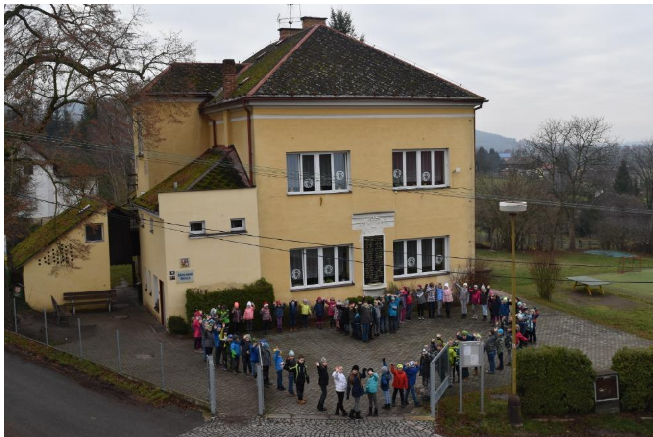
Rozloučení se starou budovou školy